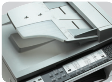
Chargeur de documents en option